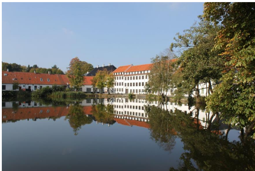
Møllesøen ved Brede Værk